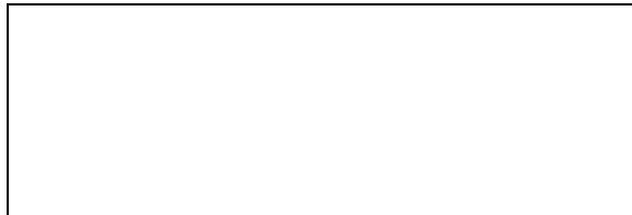
Схема границы балансовой принадлежности тепловых сетей

Прочие сведения по установлению границ раздела балансовой принадлежности тепловых сетей _____